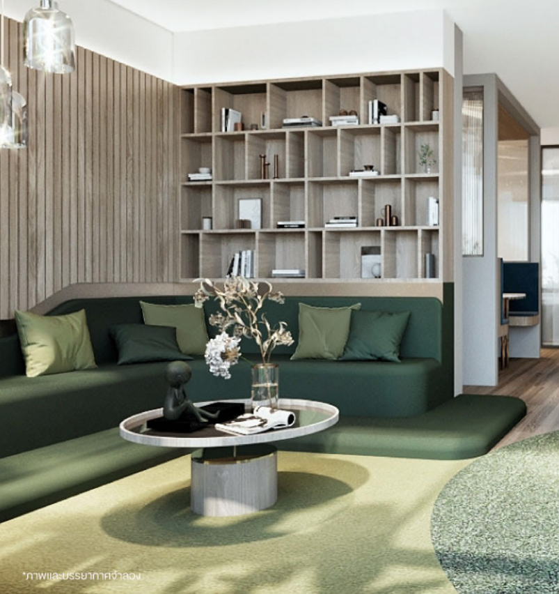
*ภาพและบรรยากาศจำลอง