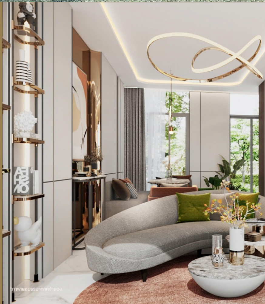
*ภาพและบรรยากาศจำลอง